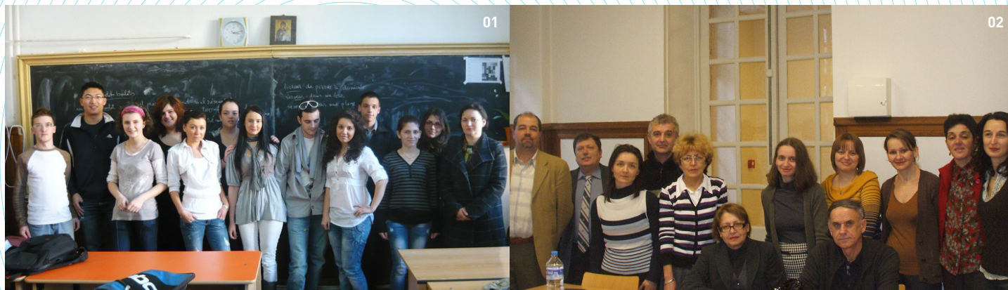
01 Deva - Collège National « Decebal » 02 Formation au CIEP pour les professeurs d'histoire