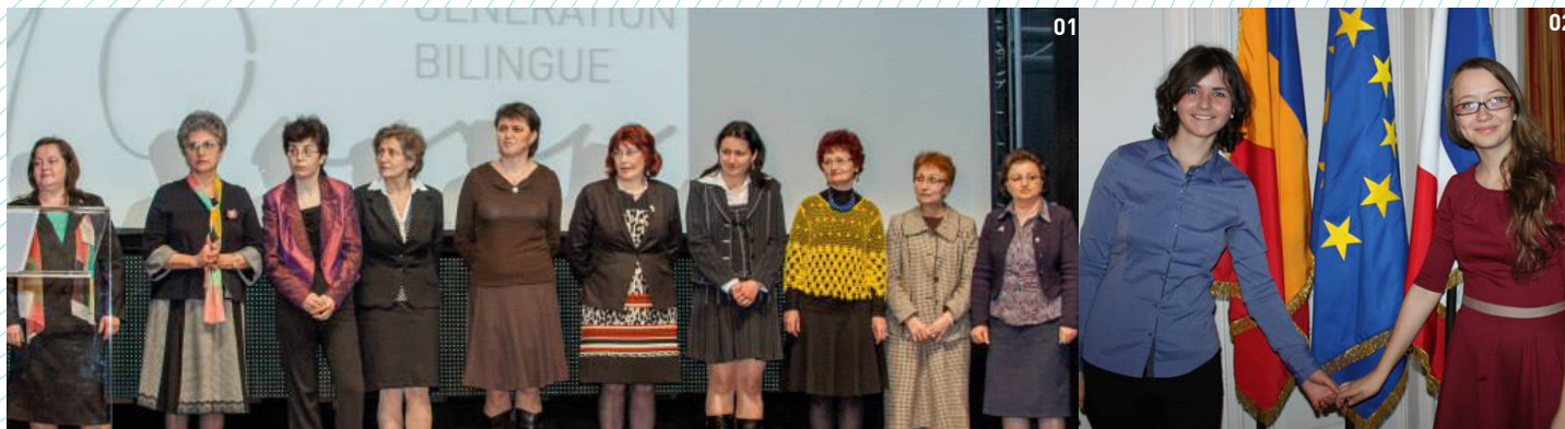
01 Cérémonie de l'anniversaire des 10 ans du bilingue - mars 2014 - Salle Elvire Popesco 02 Cérémonie de l'anniversaire des 10 ans du bilingue - mars 2014 - Ambassade de France