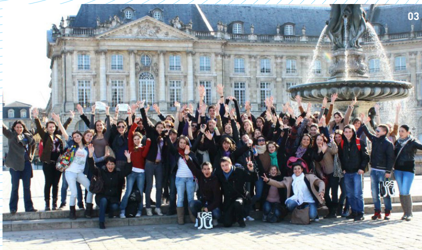
03 Échange scolaire Galati- Pessac - Place de la Bourse - Bordeaux