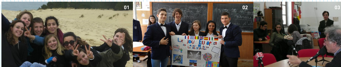
01 Echange Collège National « Elena Cuza » - Lycée Pape Clément - Pessac 02 Brasov - Collège National « Unirea » 03 RFI - La danse des mots - janvier 2014 - Ecole Centrale de Bucarest